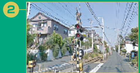
2 スーパーのある十字路を右折、突き当たるまで直進し右折。川沿いをすすみ左折。更に突き当たるまで直進し右折し、踏切を渡り、左折。