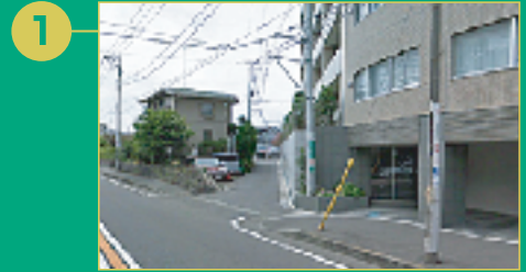
1 国道467号線より藤沢脳神経外科病院付近から江ノ電鶴沼駅方向の脇道に入る。