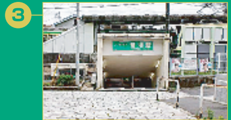
3 江ノ電鶴沼駅方向に進み、駅前に入り突き当たりを右折。