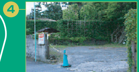
4 少し進むとパーキングの入口がありますので「榎本歯科」のプレートのある箇所に駐車下さい。 ※入口がチェーンでつながれている場合があります。お手数ですが外してお入り下さい。